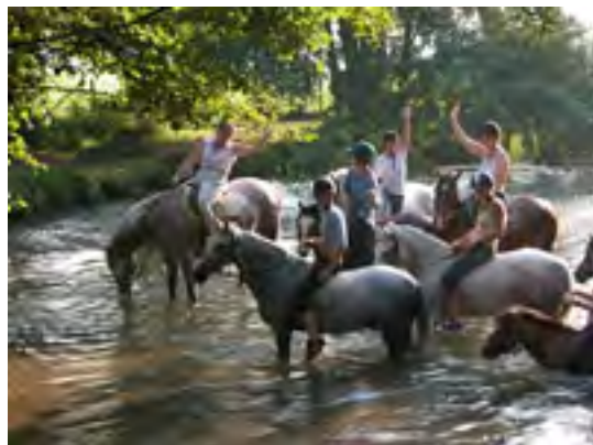
Nombreux circuits de promenade.

Des petits groupes de stagiaires. L'air iodé et vivifiant de la Manche. Un cadre rural et tranquille. Des chevaux et poneys dressés et sûrs.